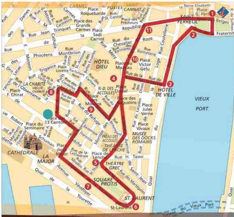
● Place des 13 cantons, 13002 Marseille